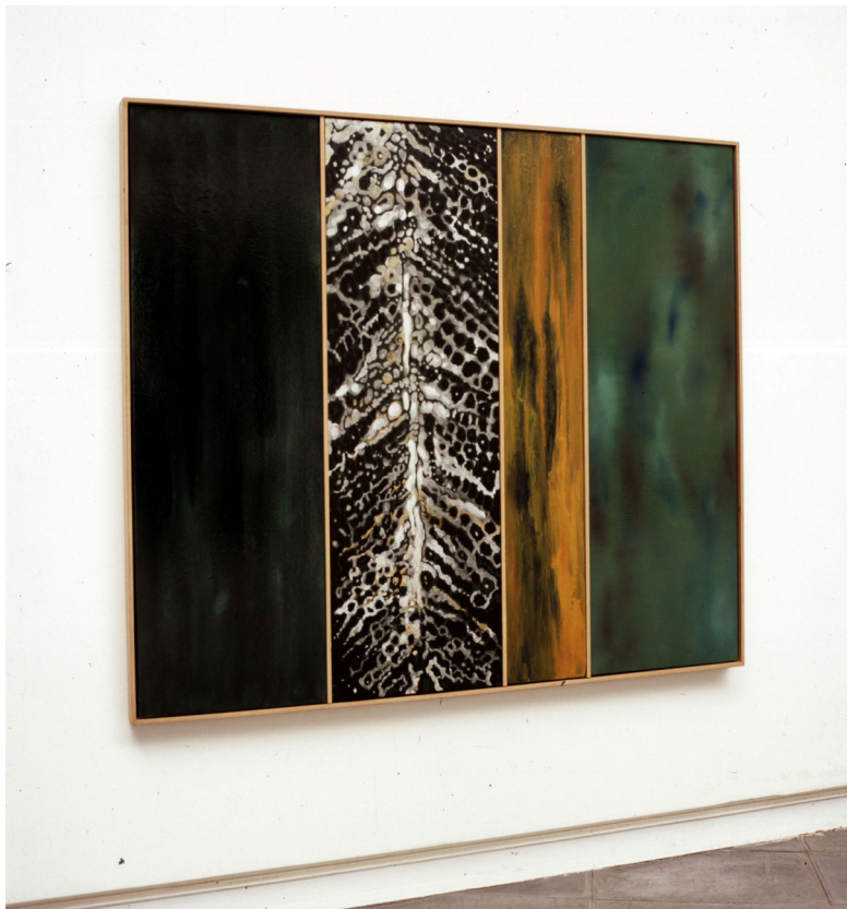
Señuelo óleo/resinas sintéticas/lienzo 132 x 166 cm.

Beranduegi baino lehen, edozein lan edo asmori begira, oroimenak gogoratzen duela gogoratu egiten du desesperatuki guregan lotzen da mugarik gabeko orainaldiaren birtualitatea gu geu eta bera ere ez nahastu asmoz. Iraupenezko oroimena, eta funtziorik nagusia ahanzturaren etengabeko erasoaldiei sendo aurre egiten dizkieten horroreen konparaketa azkar, seguru eta ordenatua delarik. Argiztapen ikarati, xumen eta beldurti honen pean, egungo praktika kreatiborik gehienek bere estura gaineztatuentzako gordelekua haragiaren