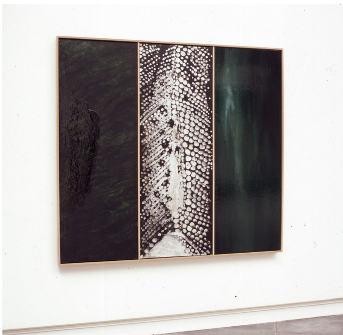
Señuelo óleo/resinas sintéticas/lienzo 132 x 166 cm.